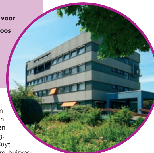
Het Gezondheidscentrum aan de Hofcampweg 65

zoals huisartsen en ziekenhuizen, en met collega-zorginstellingen, gemeente en woningbouwcorporaties."